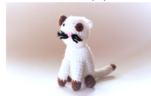
Katze weiß (C21)