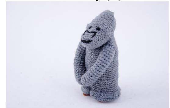
Grauer Gorilla (G8)