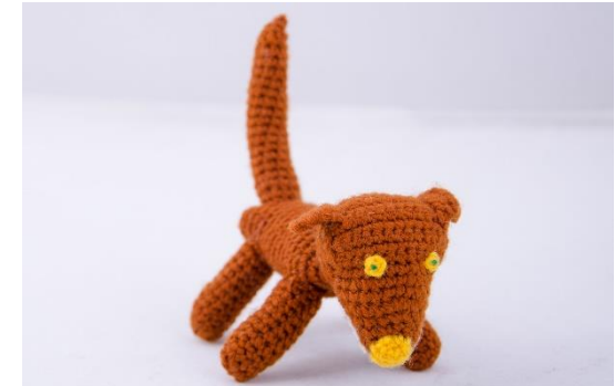
Brauner Hund (D4)