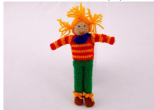
Traudi – Das schlaue Mädchen (PU7)