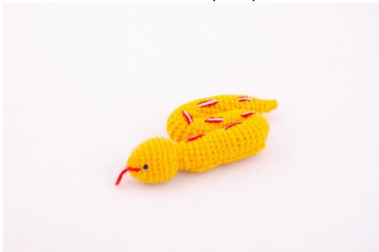
Gelbe Schlange (S8)