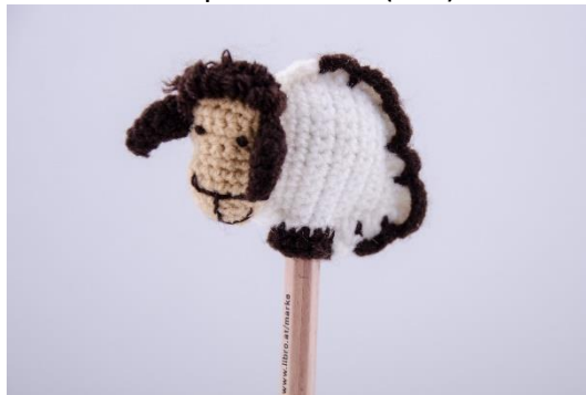
Schaf für Stifte (PE5)