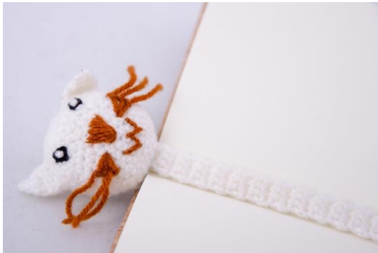
Lesezeichen Katze (BM1)