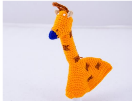
Orange Giraffe (G3)