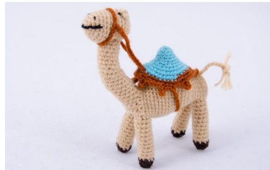
Kamel mit Decke (C1a)