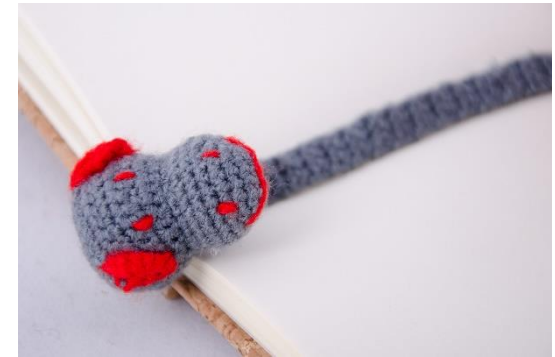
Lesezeichen Hippo (BM3)