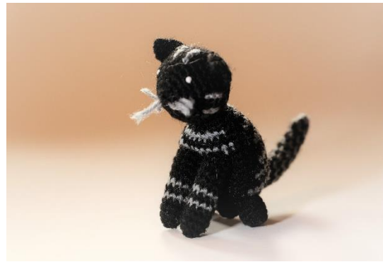
Schwarze Katze (C2)