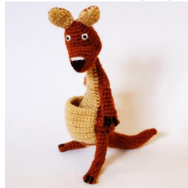
Känguruh Mama (K3)