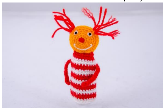
Clown rot-weiß (C7)