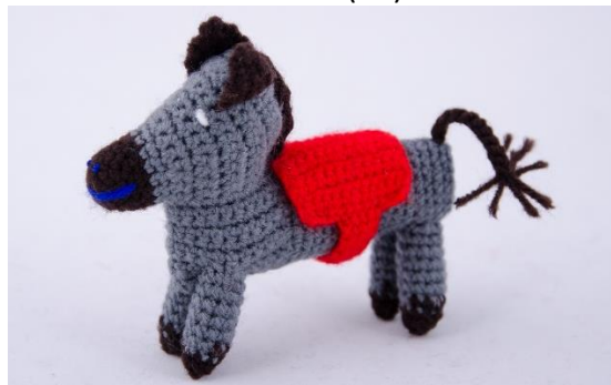
Esel 1 (D5)