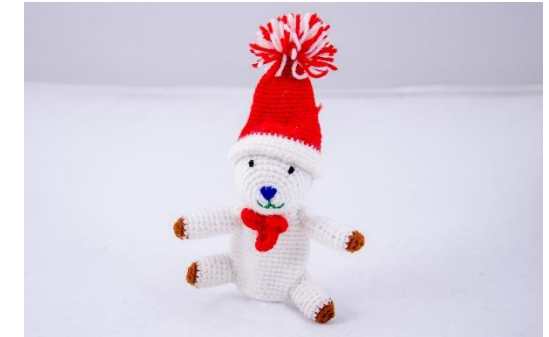
Teddybär mit Weihnachtsmütze (CH10)