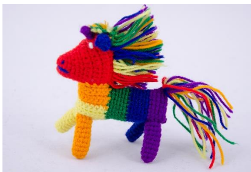
Regenbogen Einhorn (U1)