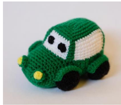
Auto grün (C18)