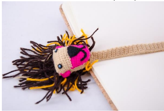
Lesezeichen Löwe (BM5)