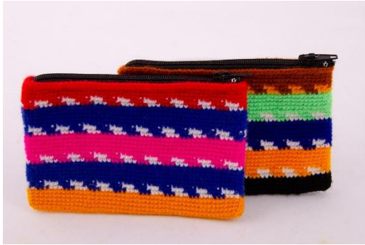
Geldtascherl in verschiedenen Farben (BA5)