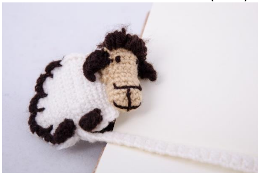
Lesezeichen Schaf (BM7)