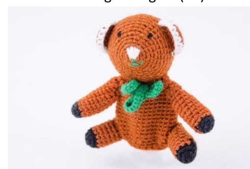
Brauner Teddybär (B2)