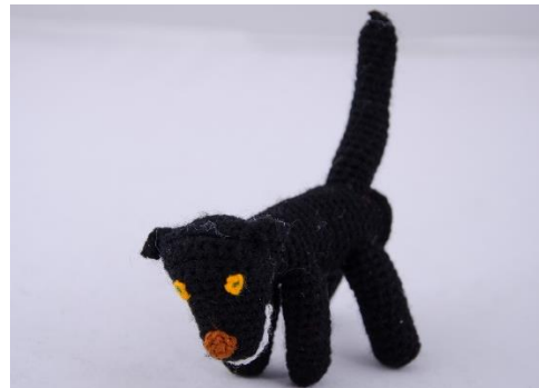
Schwarzer Hund (D3)