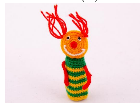
Clown grün – gelb (C6)