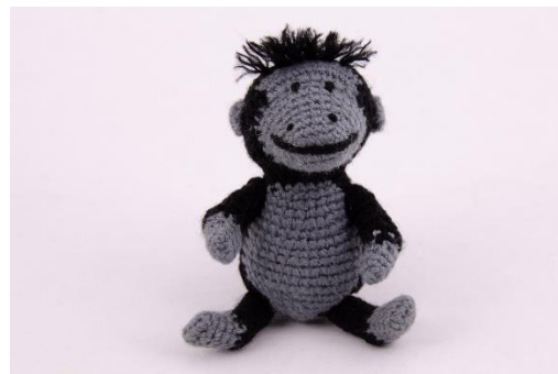
Gorilla als Puppe (G10)