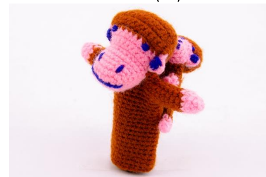
Affe mit Kind (M4)