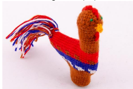
Brauner Hahn (C9)