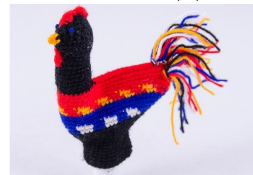
Schwarzer Hahn (C10)