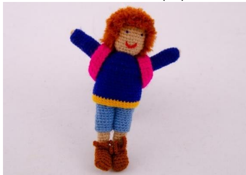
Ali – Der sportliche Junge (PU1)