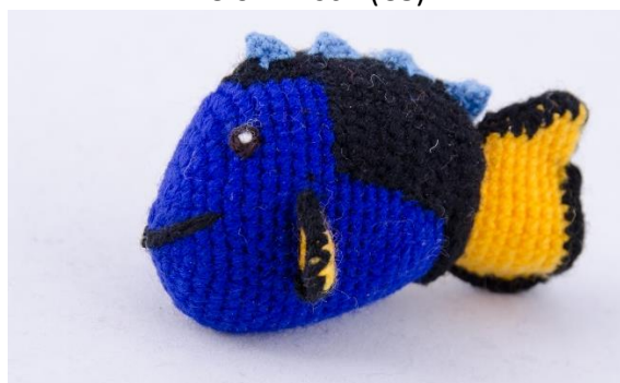
Fisch blau –gelb (F3)