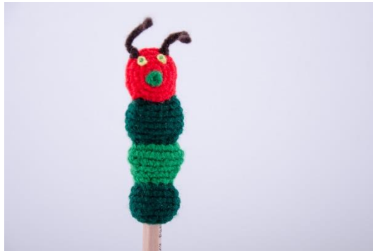
Raupe für Stifte (PE2)