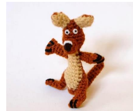
Känguruh Kind (K4)