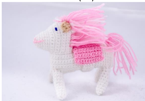
Weißes Pferd (H4)