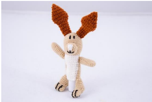
Hase groß (R1) – klein (R2)