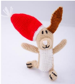
Hase mit Weihnachtsmütze (CH1)