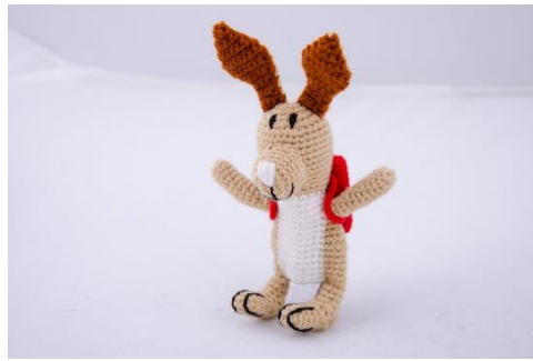
Hase mit Rucksack