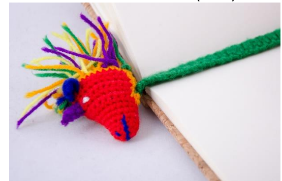
Lesezeichen Einhorn (BM9)