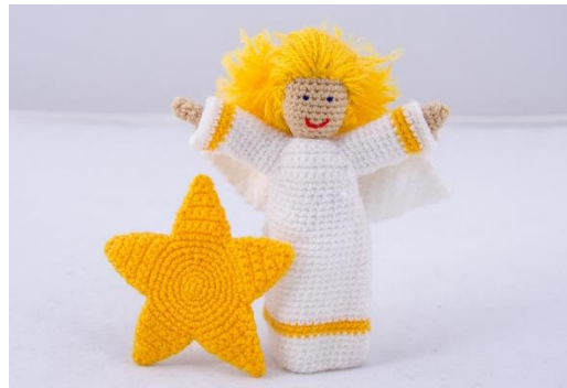
Engel mit Stern (CH2)