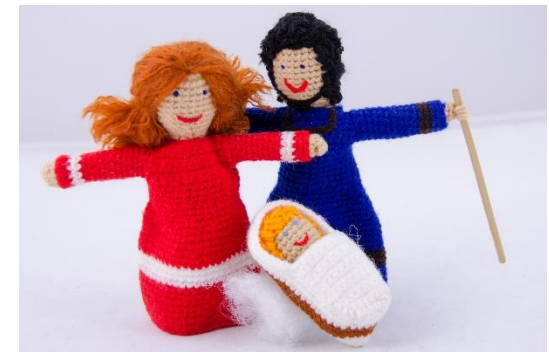
Maria (CH8), Josef (CH4), Jesuskind (CH3)