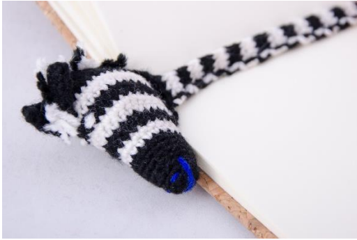
Lesezeichen Zebra (BM7)