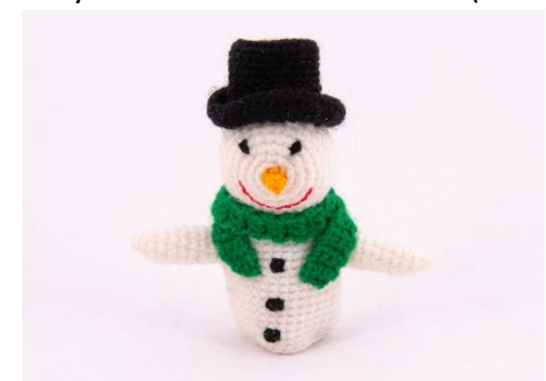
Schneemann 1 (CH13)