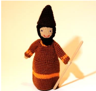
Hirte 1 (CH16)