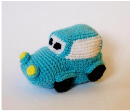
Auto blau (C17)