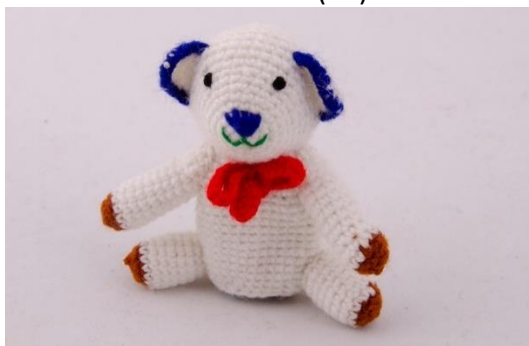
Weißer Teddybär (B3)