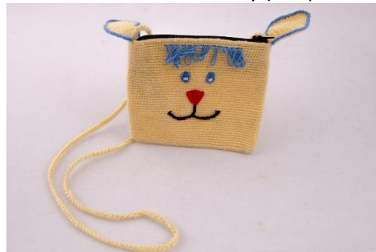
Hasenhandtasche – gelb (BA2)