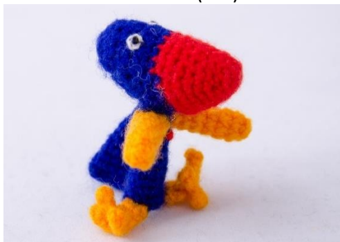
Emil – Kleiner blauer Vogel (PU2)