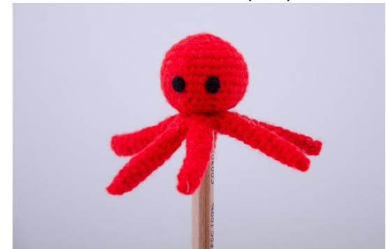
Oktopus für Stifte (PE6)