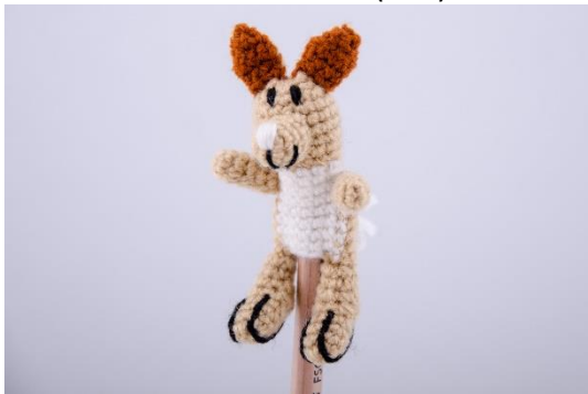
Hase für Stifte (PE4)