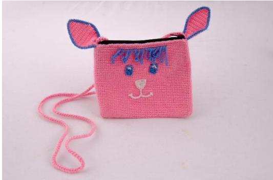
Hasenhandtasche – pink (BA1)