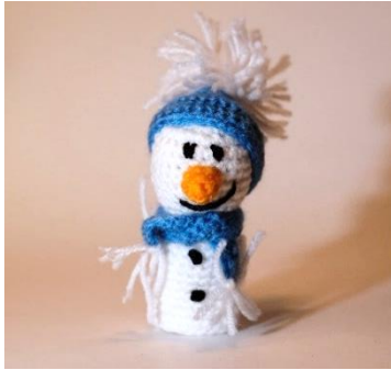
Schneemann 2 (CH14)