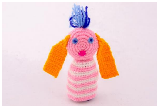
Das kleine ICH BIN ICH (L3)