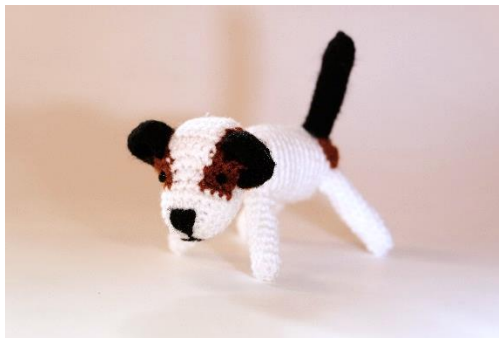
Hund weiß (D9)