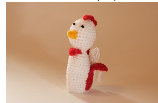
Huhn weiß (C23)