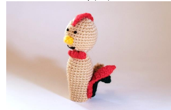
Huhn braun (C22)