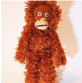
Orang Utan (O3)