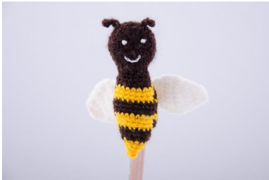
Biene für Stifte (PE1)