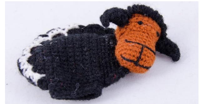
Schwarzes Schaf (S3)