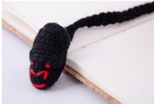
Lesezeichen Gorilla (BM2)