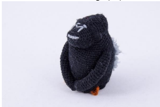
Schwarzer Gorilla (Silverback) (G7)