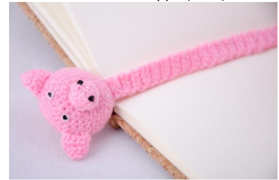
Lesezeichen Schwein (BM6)