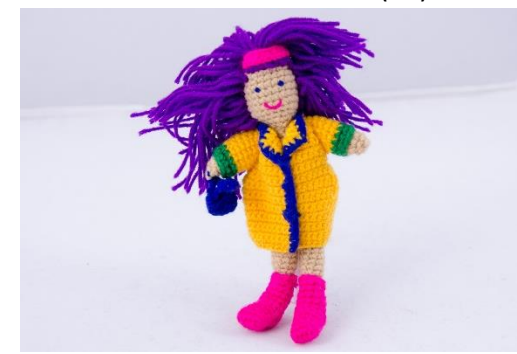
Florance – Die Gärtnerin (PU3)