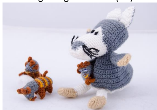
Wolf und die 7 Geißlein (W3)