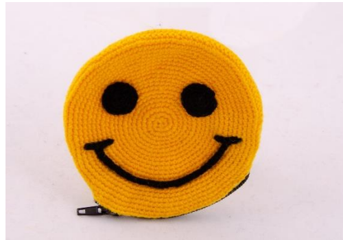
Geldtascherl Smiley (BA4)