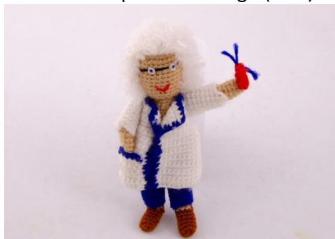
Der Professor (PU5)