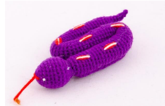
Lila Schlange (S7)