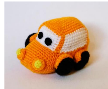
Auto orange (C19)