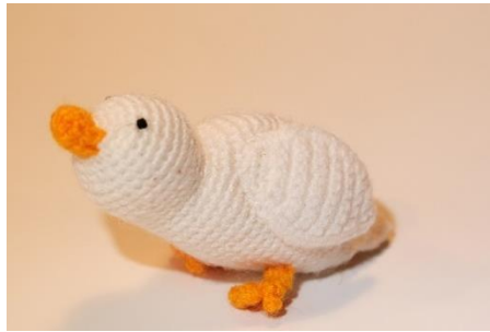
Ente weiß (D12)