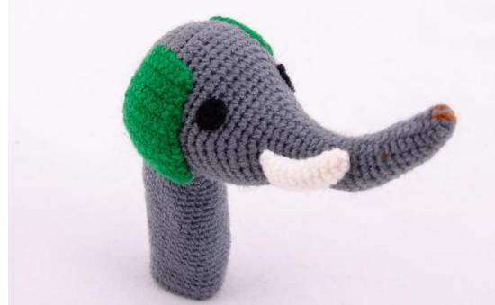
Grauer Elefant (E1)