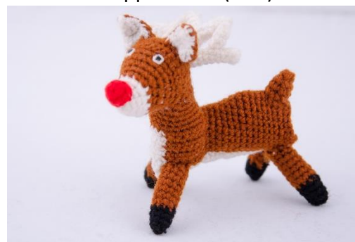
Rentier mit roter Nase (CH12)