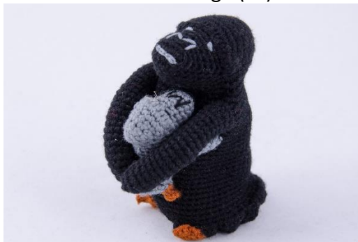
Gorilla mit Baby (G9)