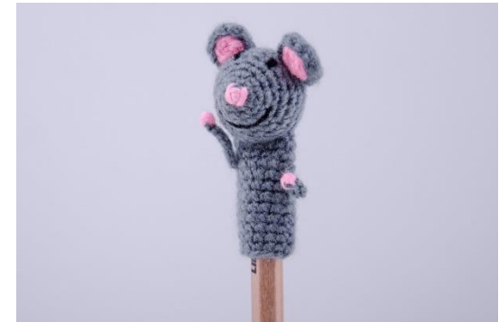
Maus für Stifte (PE3)