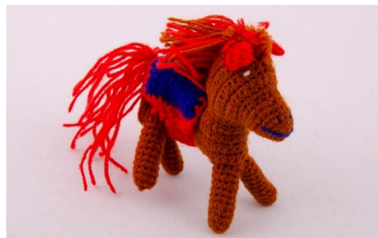
Braunes Pferd (H3)