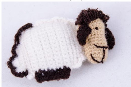
Weißes Schaf (S4)