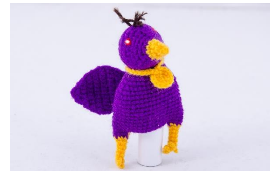
Kra – Afrikanischer Vogel (K2)