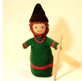
Hirte 2 (CH17)