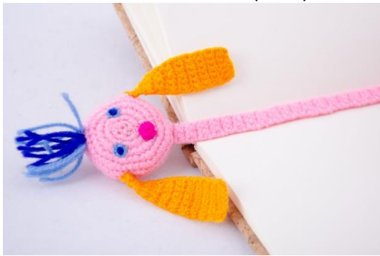
Lesezeichen Kleines Ich bin Ich (BM4)