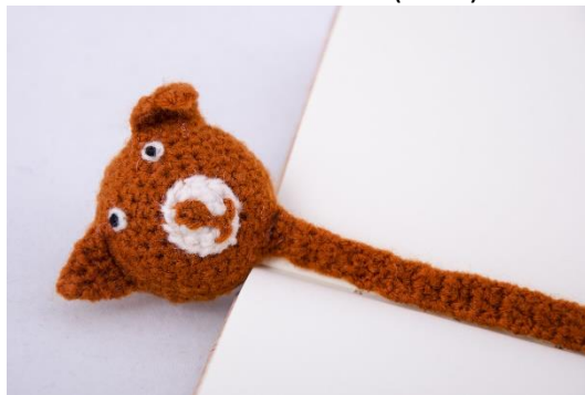
Lesezeichen Bär (BM8)