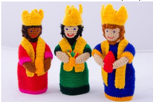
Die heiligen drei Könige (CH5, CH6, CH7)