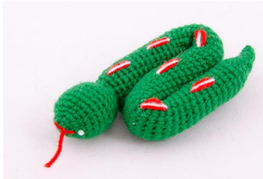
Grüne Schlange (S6)