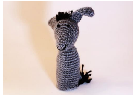
Esel 2 (D7)