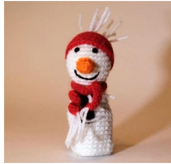
Schneemann 3 (CH15)