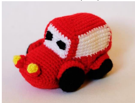
Auto rot (C20)