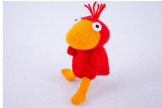
Roter Falke (F2)